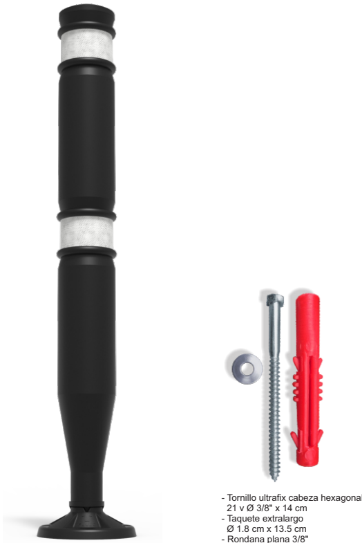
- Tornillo ultrafix cabeza hexagonal 21 v Ø 3/8" x 14 cm - Taquete extralargo Ø 1.8 cm x 13.5 cm - Rondana plana 3/8"

Sugerido principalmente para impedir que los vehículos invadan zonas prohibidas o de peligro.