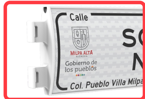
PESTAÑAS EN EL CUERPO