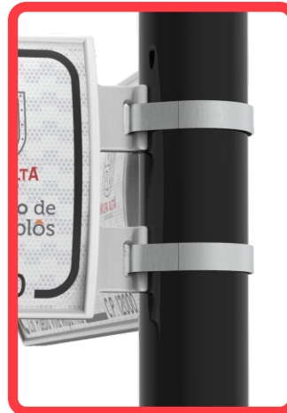
INSTALACIÓN CON FLEJE