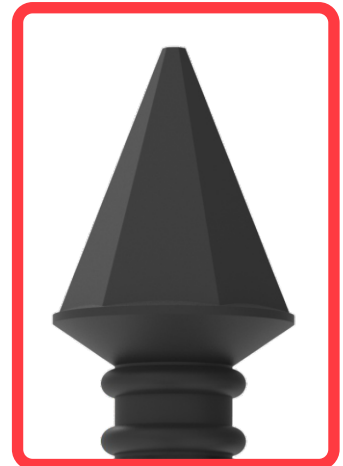
POSTE TUBULAR CON REMATE TIPO DIAMANTE