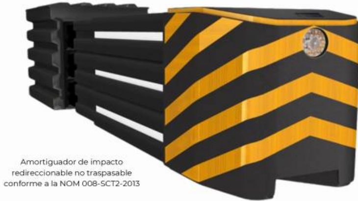
Amortiguador de impacto redireccionable no traspasable conforme a la NOM 008-SCT2-2013

El Multi-Impactor 7 marca una nueva era en la seguridad para autopistas y carreteras de alta especificación, gracias a su innovador sistema de amortiguación.