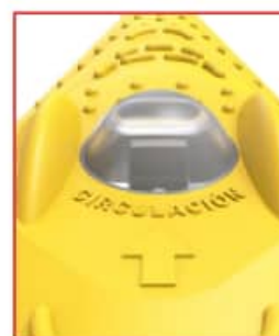
Orientación de montaje