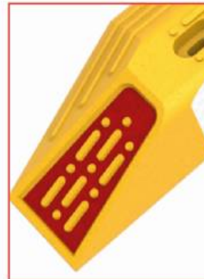
Antiderrapante y alto relieve para protección del reflejante

El Bolardo Confibici de 25 cm de ancho es la opción ideal para confinar la ciclovía en calles y avenidas en las que hay poco espacio para los carriles de los automovilistas.