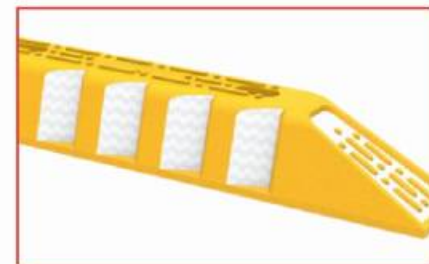
Reflejante en ángulo para una mejor visibilidad