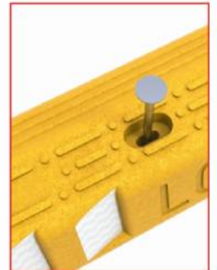
Centrar el vlvavo