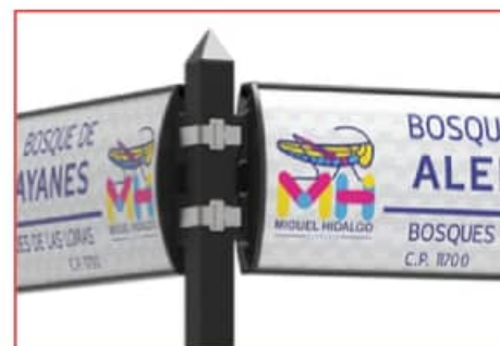
Instalación con fleje