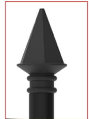
Remate tipo diamante