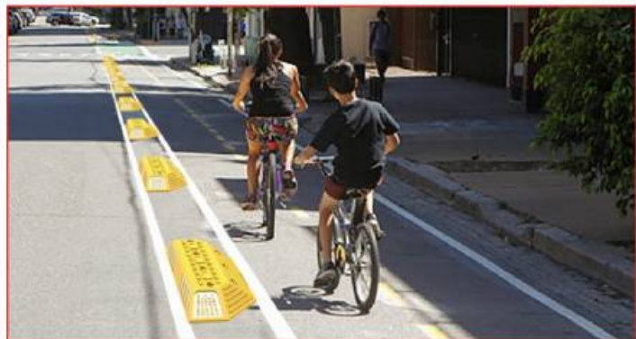
Se ancla al piso con 7 clavos 1/2" x 10" y resina epoxica