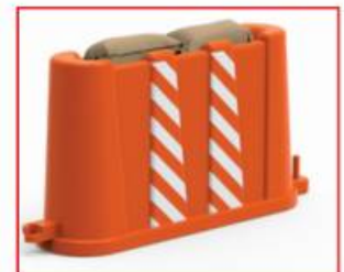
2 COSTALES DE ARENA OPCIONALES DE 10.00 KG C/U