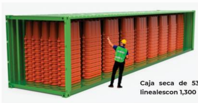
Caja seca de 53" Canalizando 1950 mts. lineales con 1,300 barreras anidables aprox.