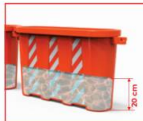
LLENADO CON AGUA HASTA 20 cm MÁXIMO