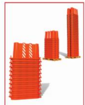
ALMACENAJE HASTA 99 PZS POR TARIMA