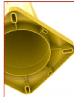
Remates que lo hacen estable

Aplicaciones. Sugerido principalmente en zonas de obra, donde se esté haciendo alguna reparación vial o donde se requiera señalar algún peligro o desviación.