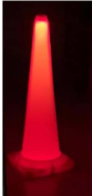
Cono amarillo con muestra de luz roja