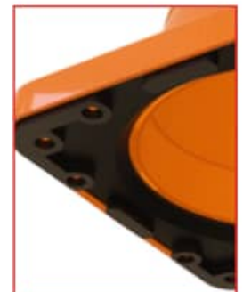
Base pesada que lo estabiliza