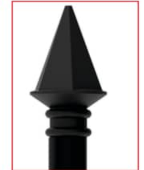
POSTE TUBULAR CON REMATE DIAMANTE