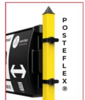
CINCHO DE NYLON, SOPORTA HASTA 100 kg