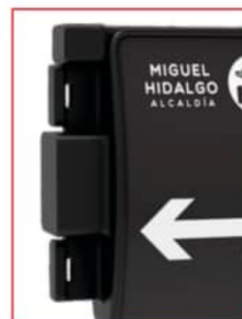
PESTAÑAS DE SUJECCIÓN INTEGRADAS